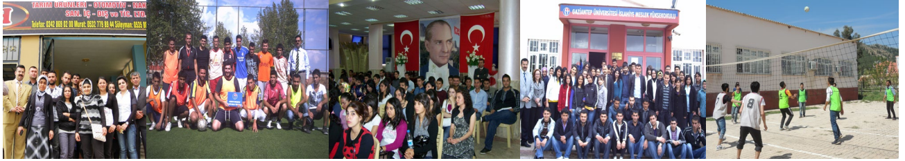
Yüksekokulumuzun Faaliyetlerinden görüntüler