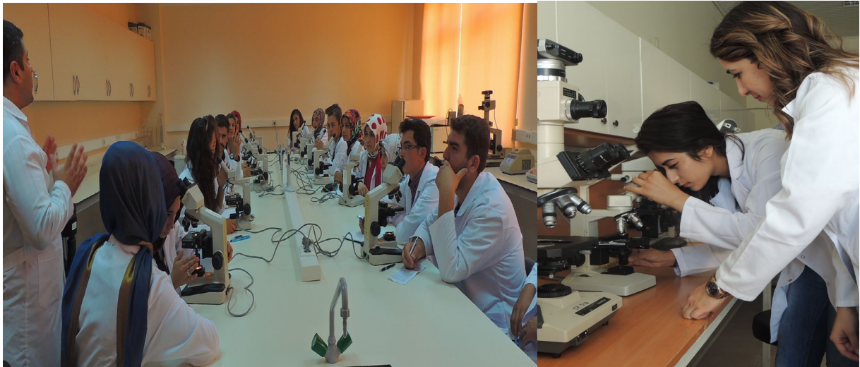
Laboratuvarımızdan bir görünüm