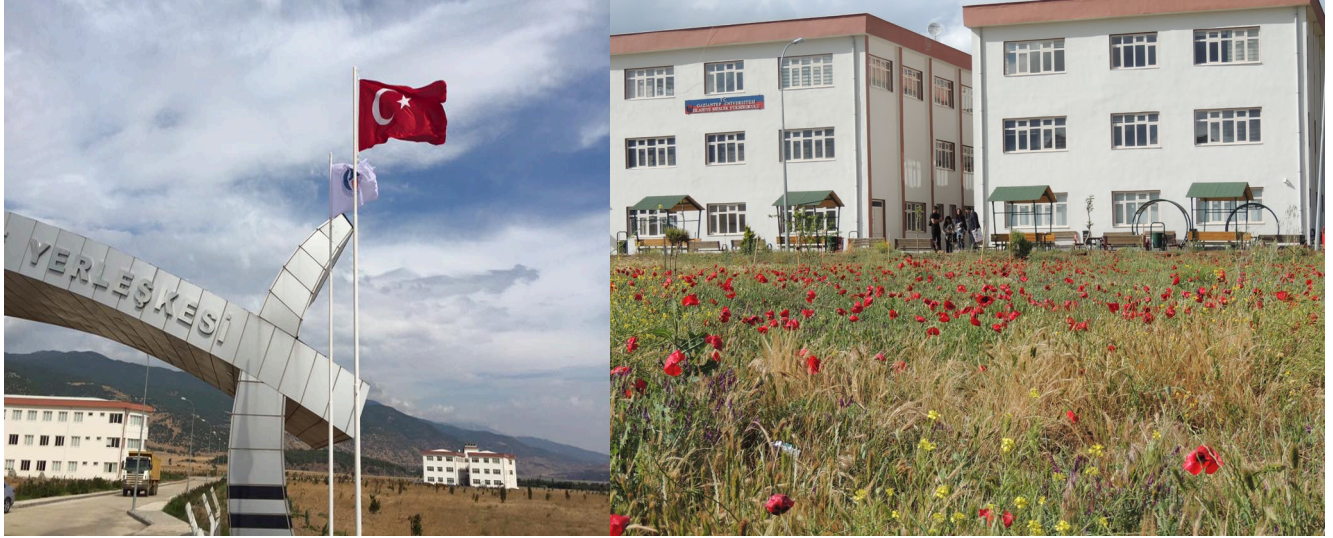
GAÜN İslahiye MYO

İslahiye Meslek Yüksekokulu, Üniversitemiz İslahiye Yerleşkesinde yer alıp, 170.000 m 2 lik açık alanda konuşlanmış ve tek bloktan oluşan yeni inşa edilen binada 2509 m 2 kapalı alanıyla eğitim-öğretim faaliyetlerini sürdürmektedir. İslahiye Meslek Yüksekokulu binası resimde gösterildiği gibidir.